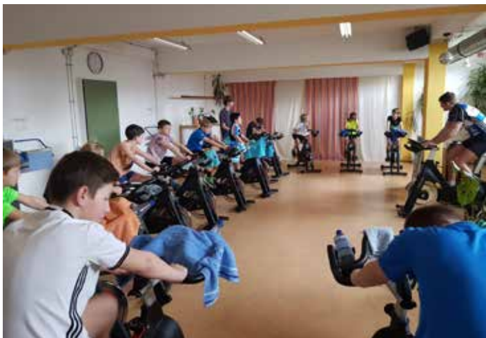
Training mal etwas anders: Strampeln auf dem Spinning-Bike anstatt Bälle werfen in der Halle.

mannschaft strebt erneut den Klassenerhalt in der höchsten Spielklasse auf Bezirksebene an, die 2. Mannschaft möchte aufsteigen, und die 3. Mannschaft bietet Jugendspielern den Einstieg in den Aktivenhandball. In der Jugendabteilung wachsen vielversprechende Talente heran, die es weiter zu fördern gilt, um den Handball beim TV Wetzlar weiterhin aufrecht zu erhalten. Dabei erfreuen sich, sofern möglich und erlaubt, alle Sportler zahlreicher und tatkräftiger Unterstützung in der Halle und abseits des Spielbetriebes und wünschen ein sportlich erfolgreiches und vor allem gesundes Jahr 2022.