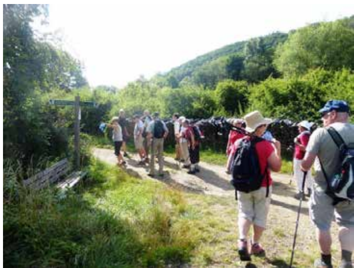
Wo geht's denn hier weiter?

Erstmals in der Phase der Lockerung der Pandemievorschrift lud die Wanderabteilung ihre Mitglieder unter dem Motto „Der TV-Wetzlar wandert wieder“ unsere Wander-Freundinnen und -Freunde zur ersten Wanderung am 18. Juli ein. Der Weg führte vom Parkplatz hinter dem neuen Rathaus über den Weinberg in Richtung Oberndorf. Dem Wunsch der Teilnehmer entsprechend, Anfahrten zu den Wanderzielen möglichst kurz zu halten, wurde die nächste Wanderung am 15. August in den Naturpark Taunus in Cleeburg gelegt. Wie auch im Juli wurde diese Wanderung von 15 Wanderinnen und Wanderer angenommen. Hier folgten wir der Route „Seegrund“.