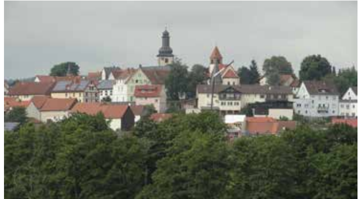
Ein Blick auf Herbstein. Entlang des Vulkanradweges.

Die Radsportabteilung des Turnvereins-Wetzlar hat auch 2021 vom 7. Bis 27. Juni am Stadtradeln teilgenommen. Mit 16 Teilnehmer strampelten wir in dieser Zeit 5666 km und kamen auf Platz 11. Die Schwimmer des TV-Wetzlar schafften nur 3905 km mit 18 Teilnehmern und landeten auf Platz 18. Wären sich die Abteilungen einig gewesen, hätten wir zusammen Platz 5 erreicht. In dieser Zeit bin ich das Lahntal rauf- und runtergefahren. Zusätzlich war ich an der Ostsee. Als Stadtradelstar habe ich bei 366 Teilnehmer Bundesweit Platz 24 mit 1665 km erreicht.