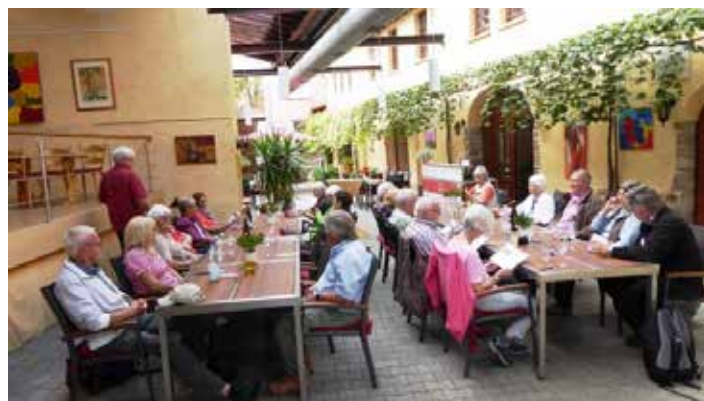
Weinprobe im Weingut Zimmermann

Um 17 Uhr traten wir mit „roten Wangen“ (von der Weinprobe) gut gelaunt die Heimreise an. Alle Teilnehmer fanden diese Wanderung nebst Weinprobe sehr gelungen.