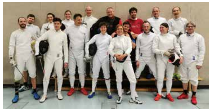
Trainer und Teilnehmerinnen am VII. Breitensportlehrgang Fechten in Heidenheim 12/2021

Das Seminar fand unter strengen 2G-plus-Bedingungen statt. Alle hatten mindestens zwei Coronaschutzimpfungen und testeten sich zusätzlich im örtlichen Testzentrum der Stadt Heidenheim.