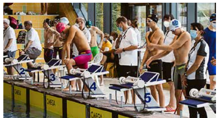
Wettkampf in Wetzlar.