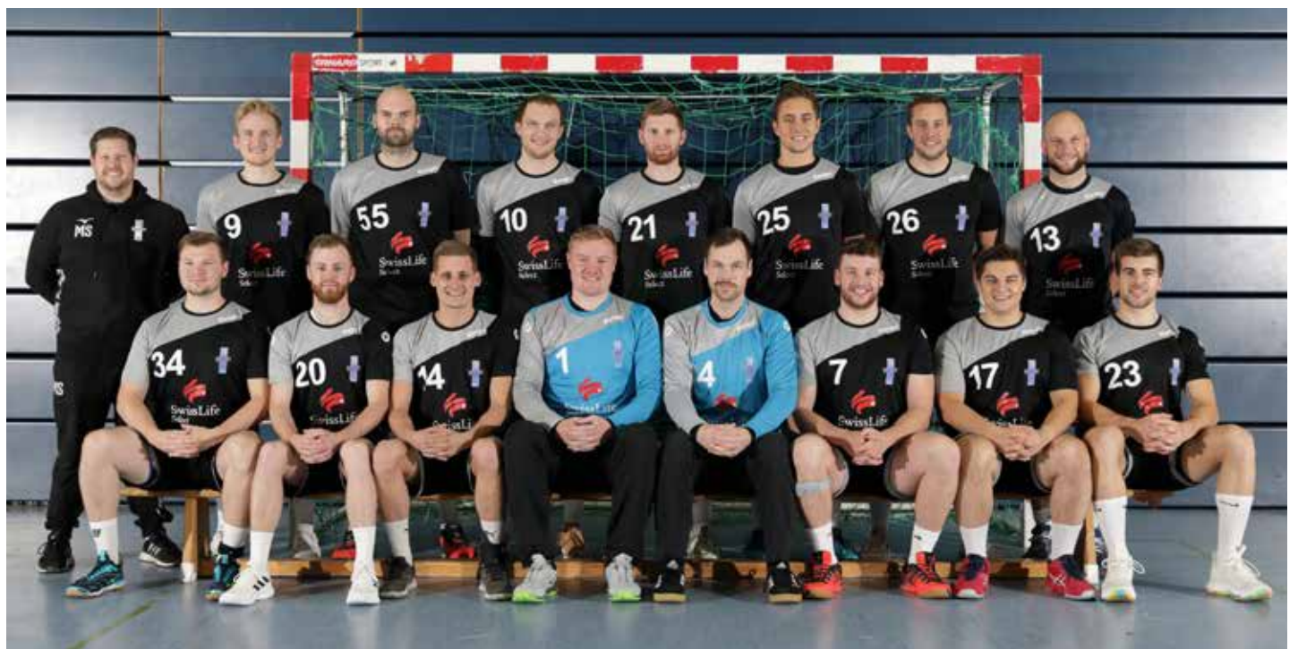
1. Mannschaft TVW Männer