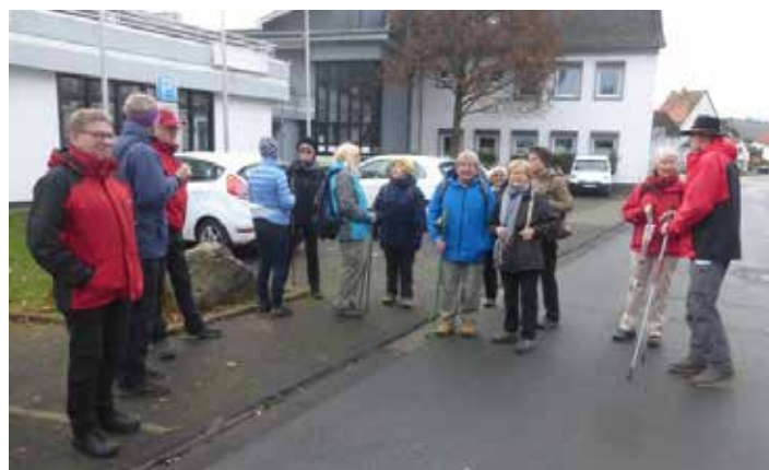
Bereit zum Abmarsch in Großrechtenbach

Wunschgemäß führte uns am 17. Oktober Hans Steinbach durch das Gebiet um Bissenberg. Auch hierzu konnten wir ca. 15 Personen bei herrlichem Wanderwetter begrüßen.