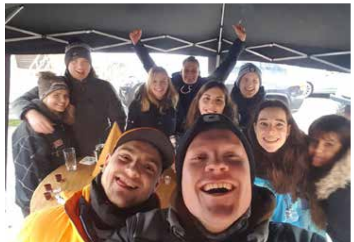
Wir kommen wieder...!

Alle waren sich anschließend einig, dass die „Woschküch“ nicht zum letzten Mal Ziel einer solchen Wanderung gewesen sein sollte. „Wir kommen wieder!“