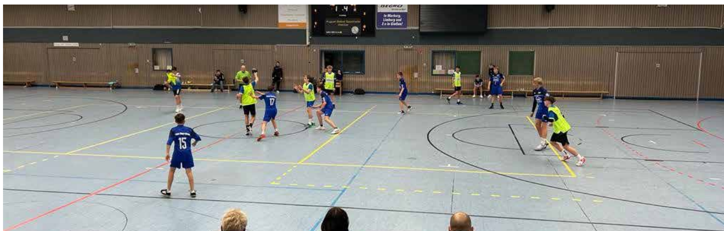
Die Jungs der C-Jugend beim Heimsieg gegen den VfB Driedorf.

Trotz einiger Widrigkeiten kann man also von einem erfolgrei-