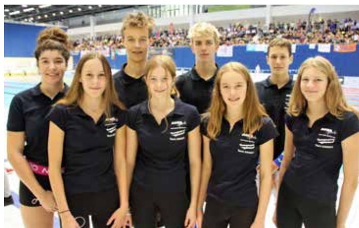
Das Team des TV Wetzlar bei den „Deutschen“.

Mit drei Finalteilnahmen der besten acht Deutschen in seinem