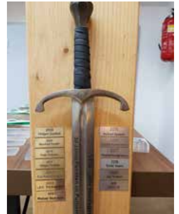
Wandertrophäe „Alte Haudegen“ der Fechtabteilung des Pulheimer Sportclubs. Letzter Gewinner 2020: Covid-19.